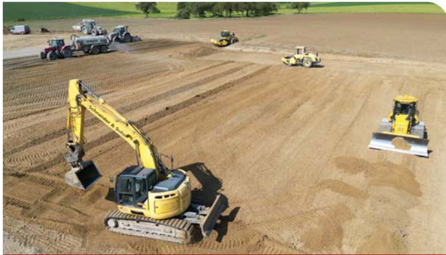
Erdarbeiten mit Bodenverbesserung

Wir sind Profis im Erdbau und bereiten den Boden für Ihr Bauvorhaben. Dabei können wir auf einen umfangreichen Maschinenpark und digitale Steuerungssysteme zurückgreifen, mit denen Baugrubenaushub und Befestigung cm-genau gelingen. Ausgeklügelte Planung im Vorfeld und eine effiziente Disposition sorgen dafür, dass die richtigen Maschinen immer dann vor Ort sind, wenn sie gebraucht werden.