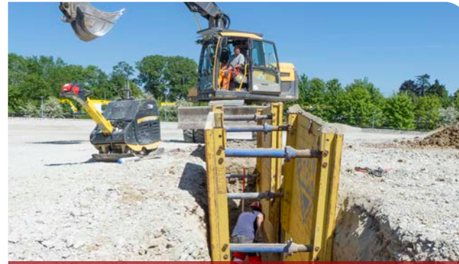
Kanal- und Leitungsbau

Fremdüberwachter Kanalbau Reg.-Nr.: 11.01.xxxx