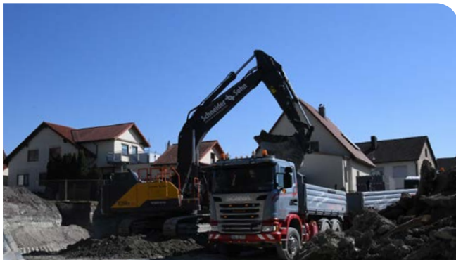
Baugrubenaushub für Tiefgarage