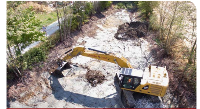
Entlandung eines Löschteichs

Arbeiten in und um Gewässer nehmen einen immer größeren Stellenwert ein. Wir unterstützen sensible Ökosysteme durch die Stabilisierung von Uferböschungen, das Ausräumen von Seen und Fischweihern, die Errichtung von Fischtreppe oder die Ansiedlung von Flora und Fauna. Dadurch schaffen wir wertvolle Rückzugsgebiete für Mensch und Tier und erhöhen die Lebensqualität im unmittelbaren Wohnumfeld.