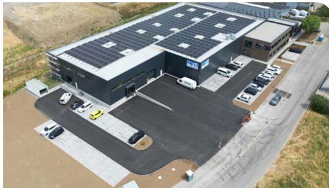
Außenanlage mit Pflaster- und Asphaltarbeiten